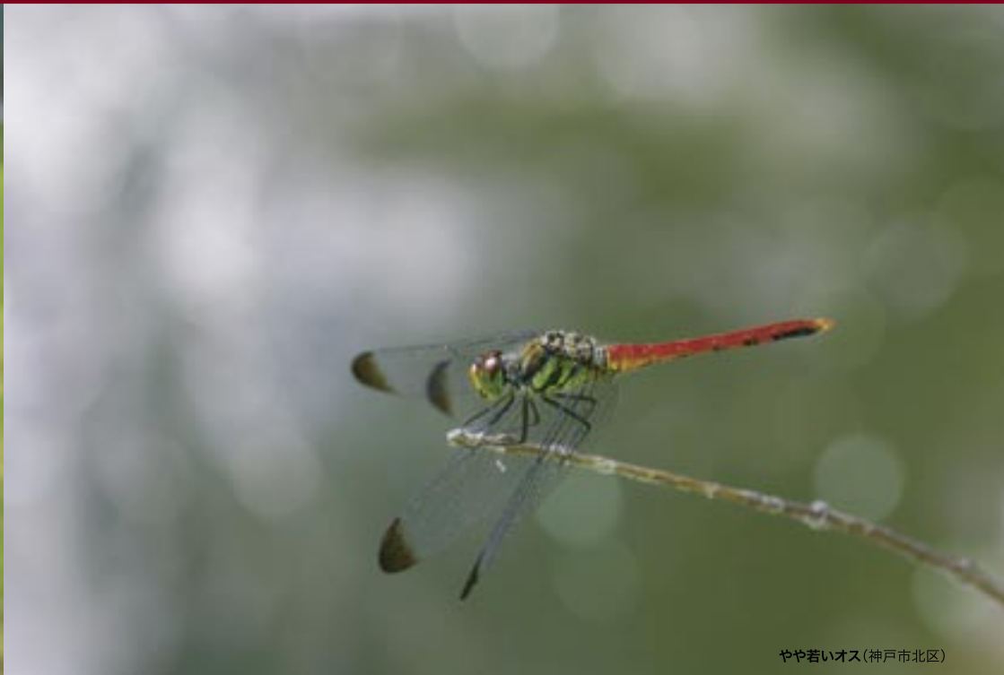
やや若いオス(神戸市北区)