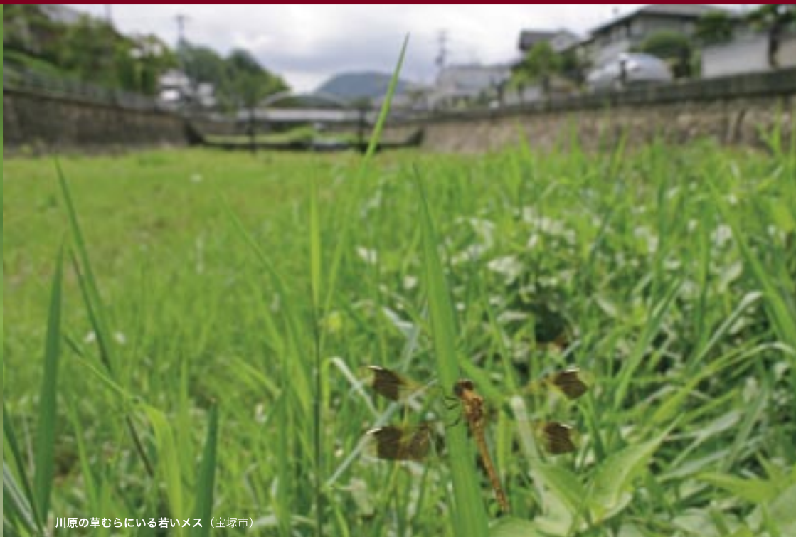
川原の草むらにいる若いメス（宝塚市）