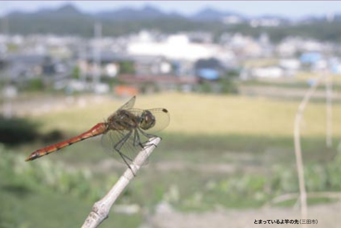
とまっているよ竿の先(三田市)