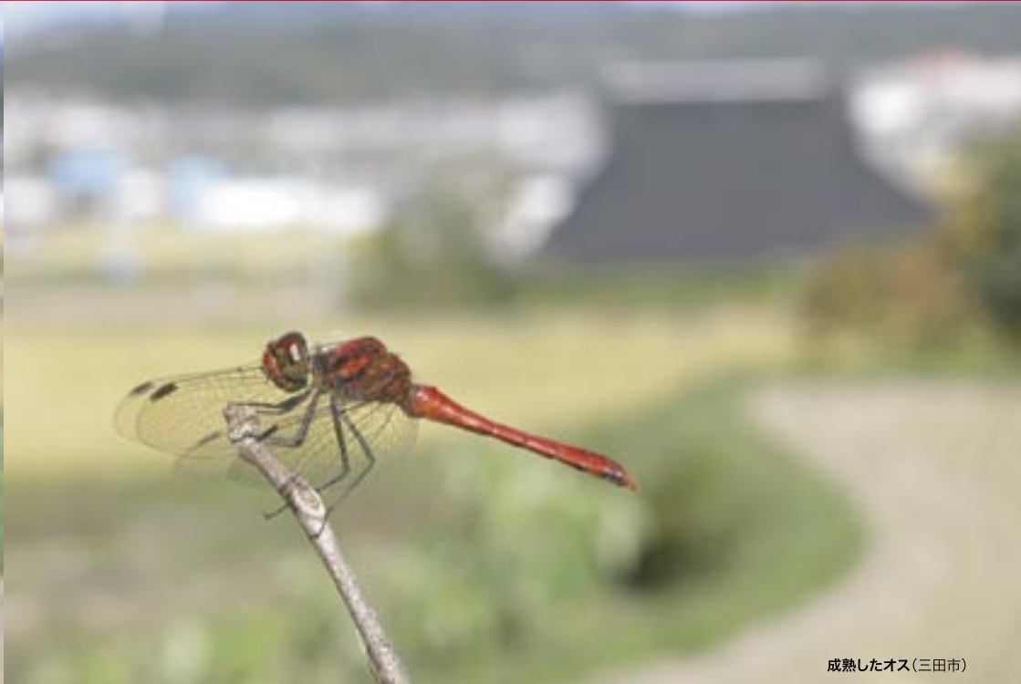
成熟したオス(三田市)