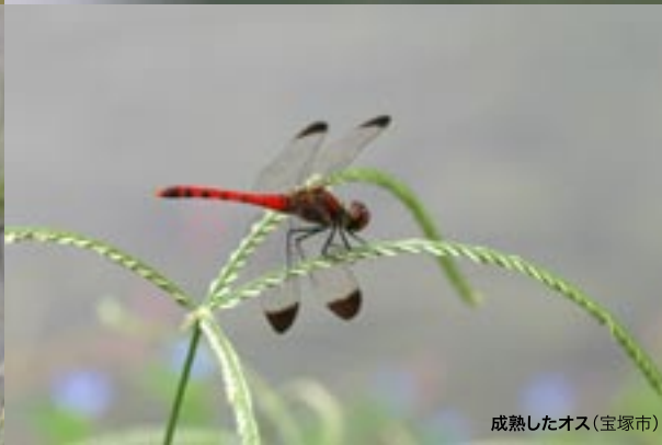
成熟したオス(宝塚市)