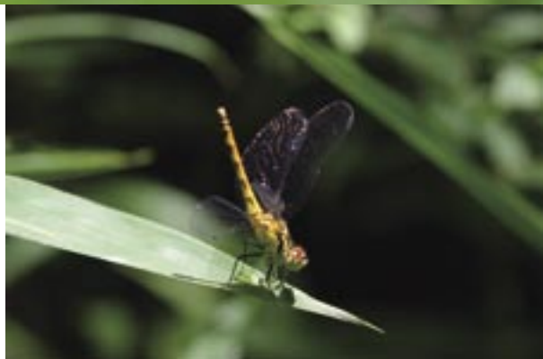
はねの先が透明なタイプの若いメス(香美町)

木立のある池や湿地、山間の田んぼ、流れのゆるやかな小川などにすむ。もっともふつうに見られるアカトンボのひとつ。暑い夏の間は近くの林の中で休んでいる。