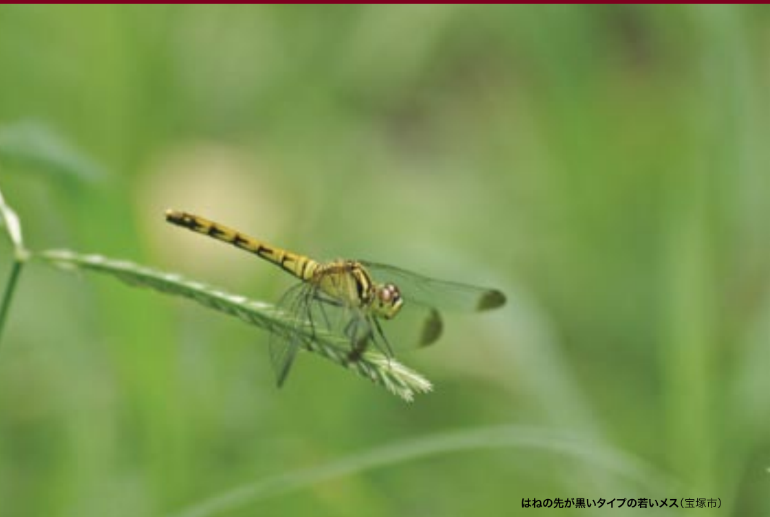
はねの先が黒いタイプの若いメス(宝塚市)