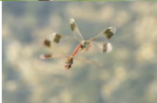
秋に見られる連結産卵（宝塚市） 流れのゆるい岸边に卵を産み落とす

兵庫県では、六甲山麓と但馬に産地が多く、西播磨、北部丹波、北摂山地にも見られる。