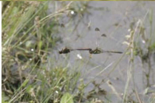
連結産卵(北海道厚真町) 水たまりに産卵にやって来た。

平地から山地まで各地にふつうで、夏の間は、林のふちの枯れ枝によくとまっている。秋になると、アキアカネ、ナツアカネとともに、田んぼにやってくる。