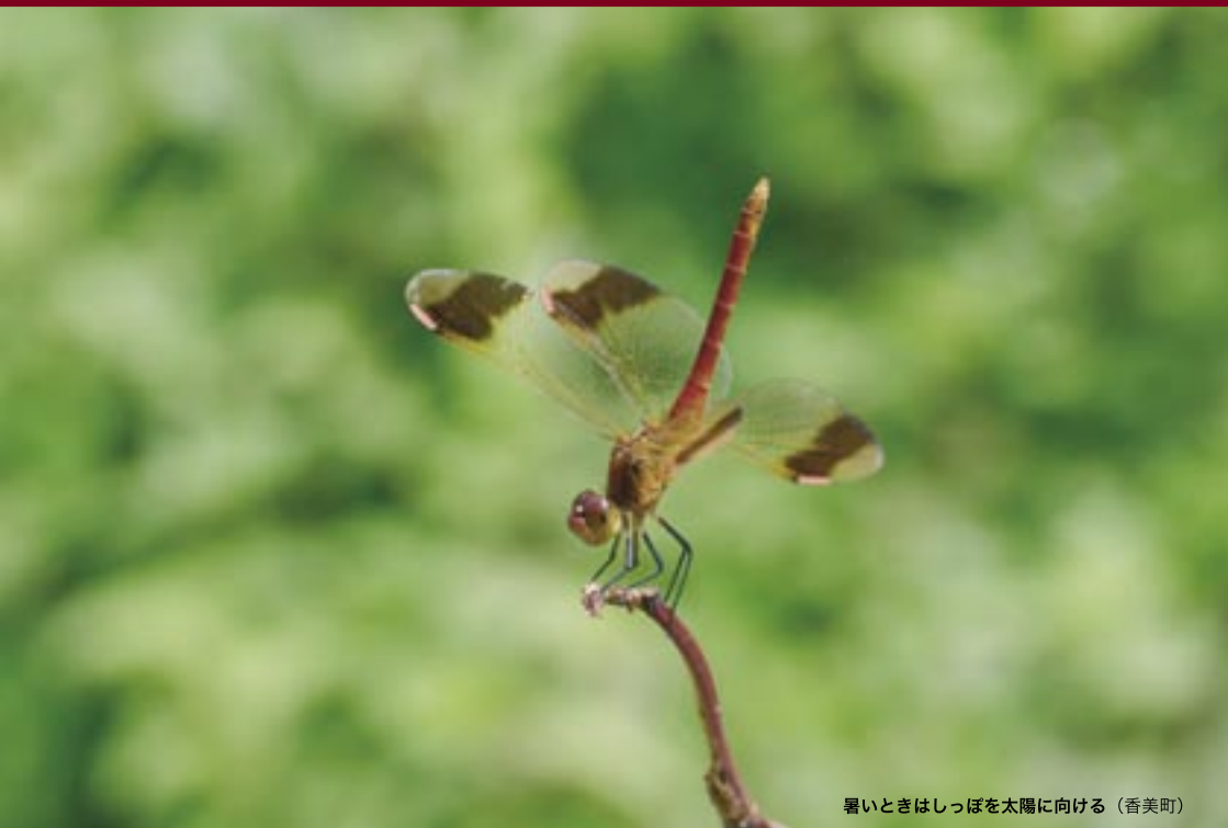
暑いときはしっぽを太陽に向ける（香美町）