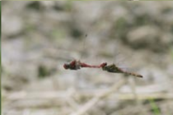
稲刈りの終わった田んぼで連結産卵(三田市) 空中から、卵をバラバラと落とす。

タイリクアカネ (大陸茜蜻蛉) Sympetrum striolatum アキアカネに似るが、体の色が濃く、はねは黄色っぽい。瀬戸内の沿岸部に多く、広い水面を好む。