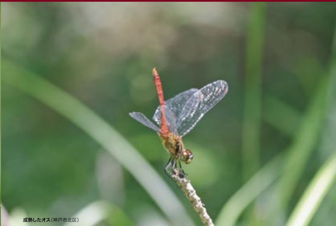
成熟したオス(神戸市北区)