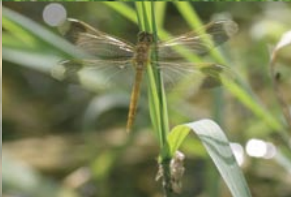
羽化したての個体（宝塚市） まだ色がうすく、はねはキラキラしている。下の方に見えるのはぬけがら（羽化殻）。

ミヤマアカネは日陰がきらいだ。決して林に近づかず、真夏の炎天下でも日当たりのよい草地に見られる。