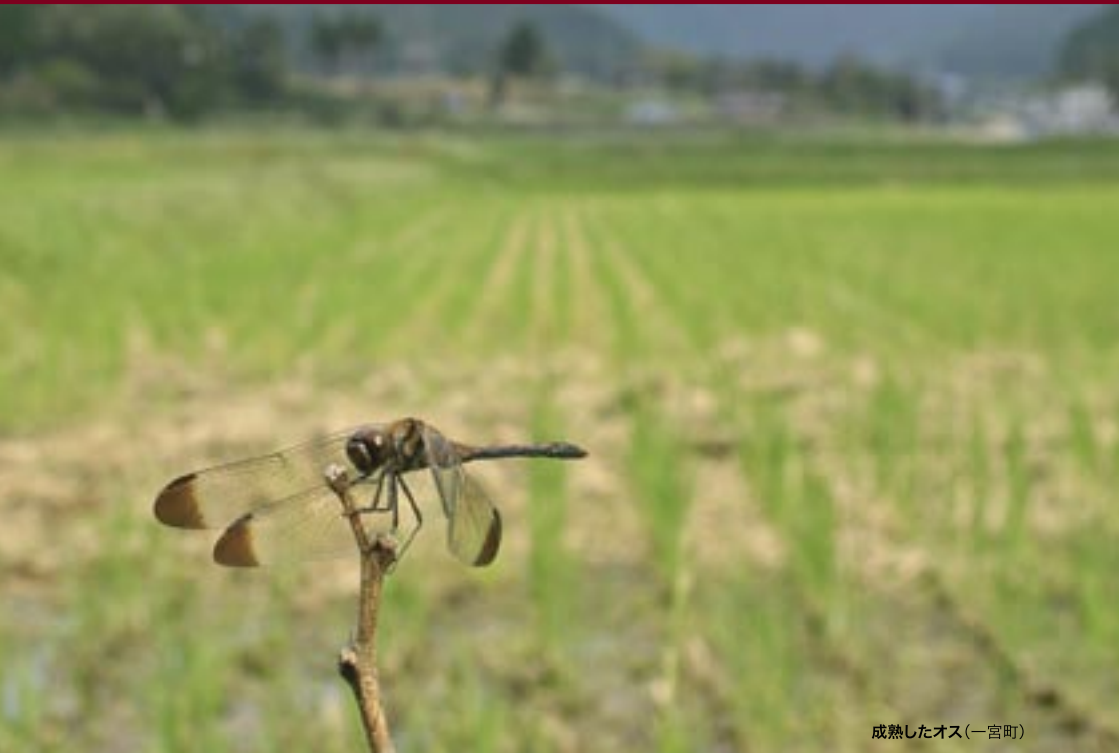
成熟したオス(一宮町)